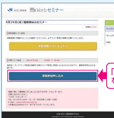
【Webセミナー事前参加申し込み画面】

Webセミナー視聴には、事前参加申し込みが必要です。 Webセミナー事前参加申し込み画面の下の青いボタン「事前参加申し込み」をクリックしてください。