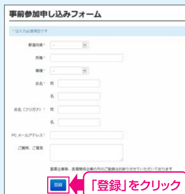
【事前参加申し込みフォーム】

※登録が完了するとすぐに「申し込み完了メール」が届きます。数時間たっても登録完了メールが届かない場合は、アドレスが間違っている可能性がございますので、再度登録願います。