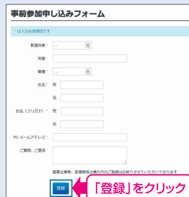
【事前参加申し込みフォーム】

※登録が完了するとすぐに「申し込み完了メール」が届きます。数時間たっても登録完了メールが届かない場合は、アドレスが間違っている可能性がございますので、再度登録願います。