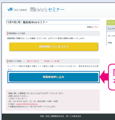
【Webセミナー事前参加申し込み画面】

Webセミナー視聴には、事前参加申し込みが必要です。 Webセミナー事前参加申し込み画面の下の青いボタン「事前参加申し込み」をクリックしてください。