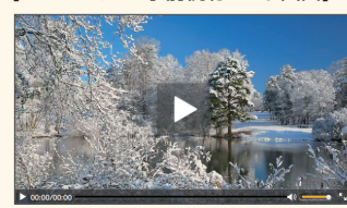
【Webセミナー事前視聴テスト画面】