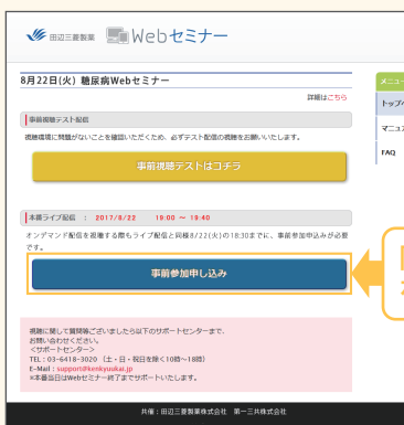
【Webセミナー事前参加申し込み画面】

Webセミナー視聴には、事前参加申し込みが必要です。 Webセミナー事前参加申し込み画面の下の青いボタン「事前参加申し込み」をクリックしてください。