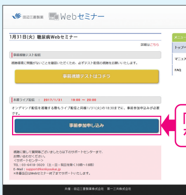
【Webセミナー事前参加申し込み画面】

Webセミナー視聴には、事前参加申し込みが必要です。 Webセミナー事前参加申し込み画面の下の青いボタン「事前参加申し込み」をクリックしてください。