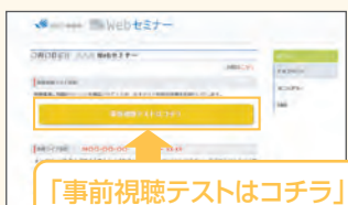
【Webセミナー事前参加申し込み画面】

ご視聴が可能かどうか(必要な動作環境にあるか ないか)は、以下のテスト画面にて事前にご確認 いただけます。