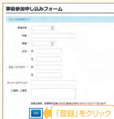
【事前参加申し込みフォーム】

※登録が完了するとすぐに 「申し込み完了メール」が届 きます。数時間たっても登録 完了メールが届かない場合 は、アドレスが間違っている 可能性がございますので、 再度登録願います。