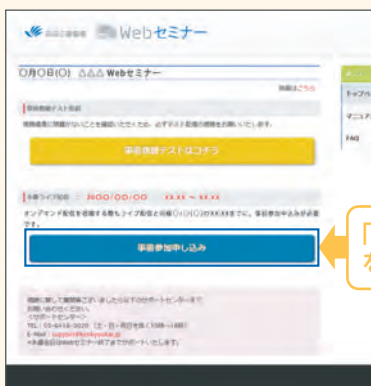
【Webセミナー事前参加申し込み画面】

Webセミナー視聴には、事前参加申し込みが必要です。 Webセミナー事前参加申し込み画面の下の青い ボタン「事前参加申し込み」をクリックしてください。