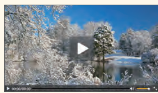
【Webセミナー事前視聴テスト画面】