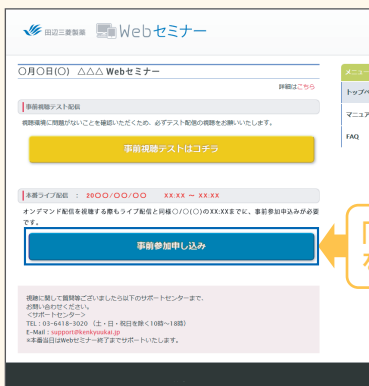
【Webセミナー事前参加申し込み画面】

Webセミナー視聴には、事前参加申し込みが必要です。 Webセミナー事前参加申し込み画面の下の青いボタン「事前参加申し込み」をクリックしてください。