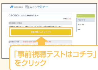
【Webセミナー事前参加申し込み画面】

ご視聴が可能かどうか(必要な動作環境にあるかないか)は、以下のテスト画面にて事前にご確認いただけます。