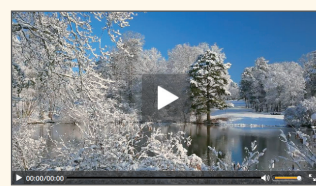
【Webセミナー事前視聴テスト画面】