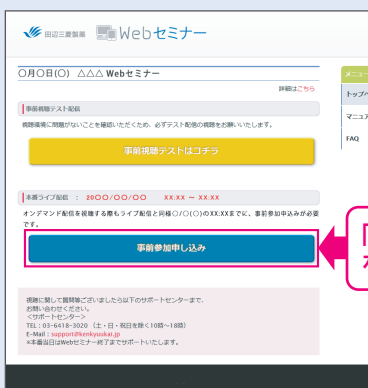
【Webセミナー事前参加申し込み画面】

Webセミナー視聴には、事前参加申し込みが必要です。 Webセミナー事前参加申し込み画面の下の青いボタン「事前参加申し込み」をクリックしてください。