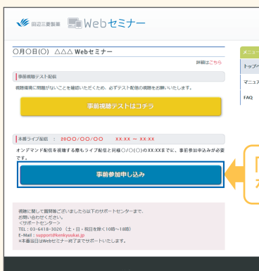
【Webセミナー事前参加申し込み画面】

Webセミナー視聴には、事前参加申し込みが必要です。 Webセミナー事前参加申し込み画面の下の青いボタン「事前参加申し込み」をクリックしてください。