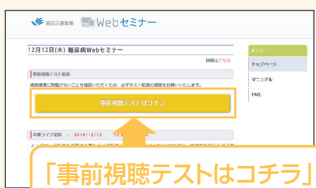
【Webセミナー事前参加申し込み画面】

ご視聴が可能かどうか(必要な動作環境にあるかないか)は、以下のテスト画面にて事前にご確認いただけます。