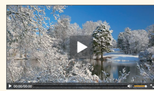
【Webセミナー事前視聴テスト画面】