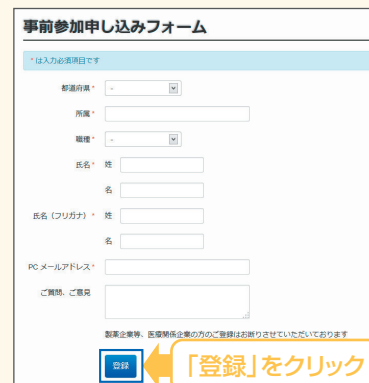
【事前参加申し込みフォーム】

※登録が完了するとすぐに「申し込み完了メール」が届きます。数時間たっても登録完了メールが届かない場合は、アドレスが間違っている可能性がございますので、再度登録願います。