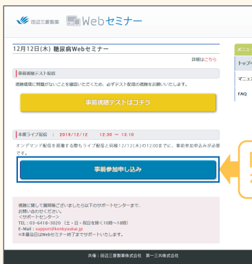
【Webセミナー事前参加申し込み画面】

Webセミナー視聴には、事前参加申し込みが必要です。 Webセミナー事前参加申し込み画面の下の青いボタン「事前参加申し込み」をクリックしてください。